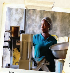
Mohizi est une entreprise ivoirienne de chips de plantain, dirigée par des femmes et soutenue par COFINA.