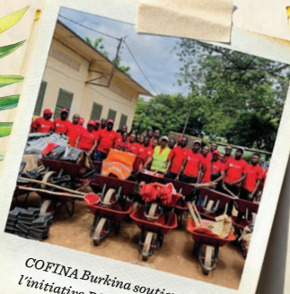
COFINA Burkina soutient l'initiative RSE Faso Mébo